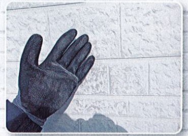
手に白い粉が付く